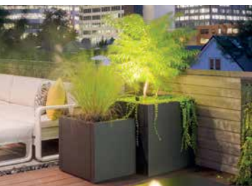
JARDINIÈRE DE LESTAGE