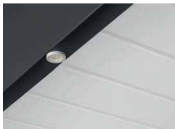
ÉCLAIRAGE LED Intégrable dans la structure