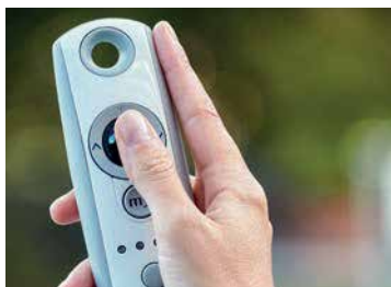
COMMANDE ÉLECTRIQUE Incluse avec chaque pergola